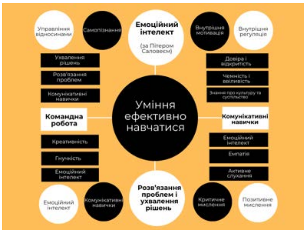
Рисунок 1 – М'які навички для життя