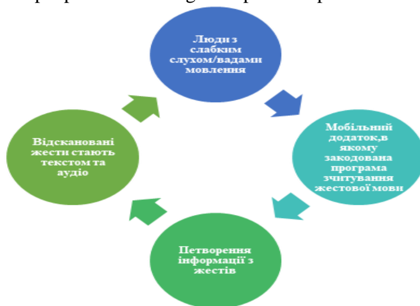
Figure shows how the EasySign startup project works

To use the application, special gloves are required, which activate the application using sensors and special software for smartphones and make it difficult to work with, due to the large gap between the languages of computer code and signs. The current realities of Ukraine indicate the depth of the problem of communication and interaction between people with hearing and speech impairments in society.