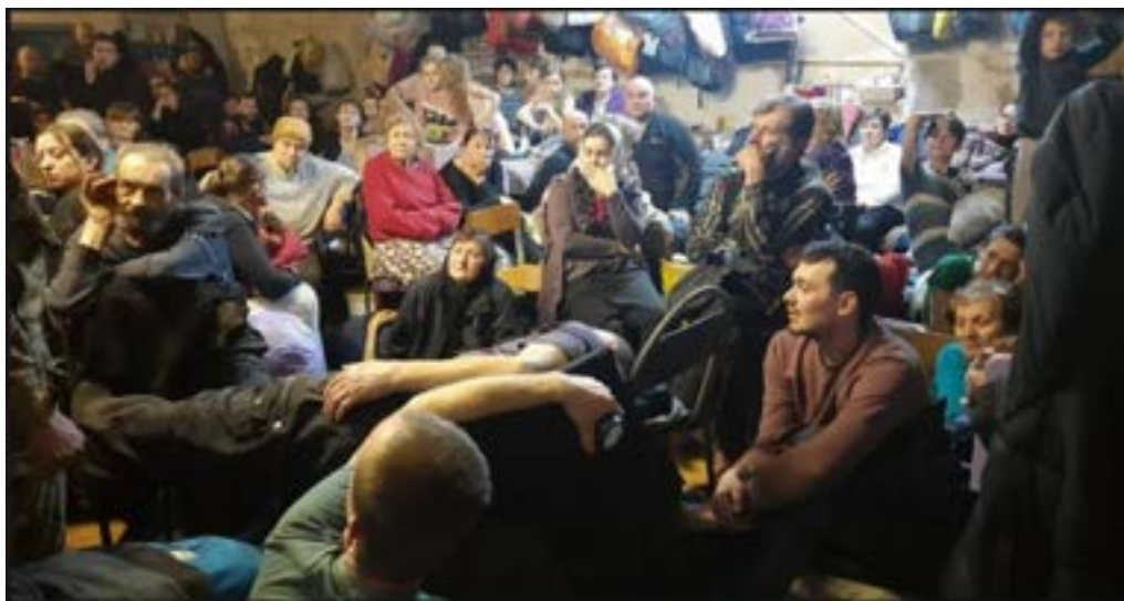
Рисунок 1 – Останні години у підвалі, 31 березня 2022-го. Фото свідка Джерело: URL : http://surl.li/rejtj